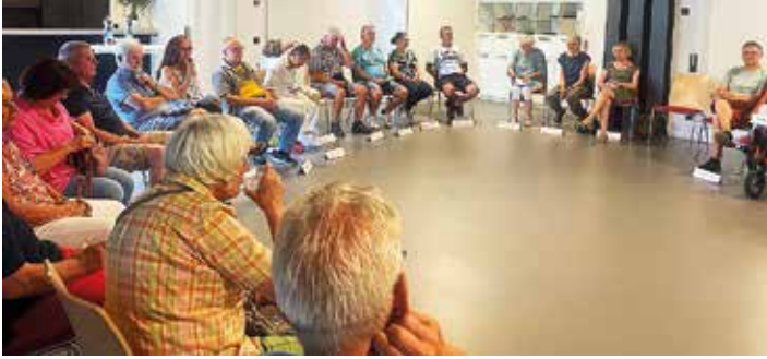
Stammtisch gemeinschaftliches Wohnen: Interessierte in großer Runde beim vorangegangenen Treffen.

Biebergemünd / Main-Kinzig (SR/jd). Die Vernetzungs- und Beratungsstelle Gemeinschaftliches Wohnen Spessart lädt ein zu einem weiteren Stammtisch rund um das Thema „gemeinschaftlich Wohnen“. Die Veranstaltung findet am Donnerstag, 16. Oktober, von 17 bis 18:30 Uhr im Bürgertreff in Biebergemünd Wirtheim statt. Die Teilnahme ist kostenfrei.