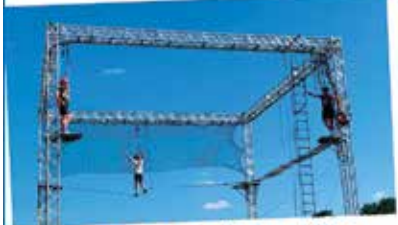
Abenteuerkick in luftiger Höhe im Hochseilklettergarten