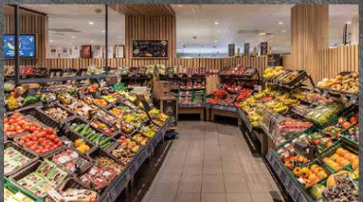
Die moderne Obst und Gemüseabteilung

Angebote gültig von Montag, 03.0 Irrtum vorbehalten. Abgabe nur in Herausgeber: Habig Supermärkte