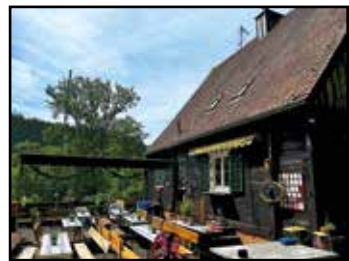
Das (Kneipp-)Wanderheim bei Bad Orb – zu jeder Jahreszeit einen Ausflug wert.

Kneipp-Vereins-Mitglieder dürfen sich freuen. Sie sind mit lediglich fünf Euro dabei. Nicht-Mitglieder zahlen EUR 17,50 für die drei Stunden (Jahresmitgliedschaft Kneipp-Verein: EUR 30,-). Teilnehmerzahl mind. vier Personen, maximal zehn. Voranmeldung unbedingt erforderlich bei Ralf Baumgarten ( info@printhouse24.de / 0172 6612032) oder Ralf Diener (0157 52361558). Ein Hinweis: Für den 13. Juli werden die Plätze bereits knapp.