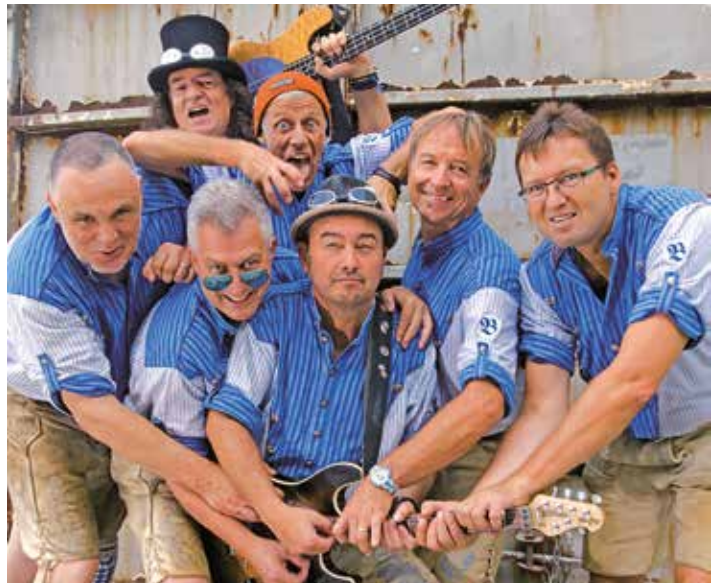
BlechHolz Blos'n am Sonntag, 21. Juli, 12 Uhr, im Schloßpark

Wie immer ist der Eintritt frei, Spenden sind willkommen.