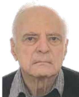
Bad Orb, im Januar 2024