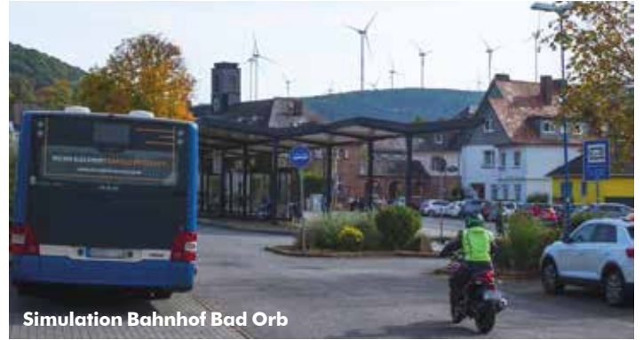
Simulation Bahnhof Bad Orb

Bad Orb / Biebergemünd / Jossgrund (GWBO/VK/hjp/rz). HessenForst hatte im September 2023 die Vorrangfläche 2-304 zwischen Bad Orb und Biebergemünd für die Bebauung mit Windkraftanlagen (WKA) ausgeschrieben. Da beide Kommunen gleichermaßen von dem Bau von WKA auf dieser Fläche betroffen sind, haben die BI Windkraft im Spessart und Gegenwind Bad Orb in Zusammenarbeit mit der Vernunftkraft Main-Kinzig-Kreis / Naturpark Spessart eine professionelle Simulation in Auftrag gegeben. Bestandteil der Visualisierung sind sowohl Bilder der betroffenen Ortsteile als auch ein Video mit einer Darstellung des gesamten Umfelds. Die Visualisierung ist unter dem Link https://www.windkraft-im-spessart.de/fileadmin/user_upload/Visualisierung_Bad_Orb_2.mp4 abrufbar und außerdem Teil des Mein-Blättche-YouTube-Videos zum Vortrag über die „Windkraft im Spessart“. Die Visualisierung zeigt, dass Windkraftanlagen auf der Fläche 2-304 im südlichen Bereich nahezu im ganzen Biebertal bis hin nach Kassel sichtbar sind, wobei in Bieber aufgrund des geringen Abstands die Belastung der Einwohner durch optische Bedrängung, Schattenwurf und Lärmemission am stärksten sein wird. Im nördlichen Bereich