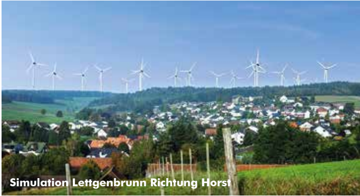
Simulation Lattgenbrunn Richtung Horst