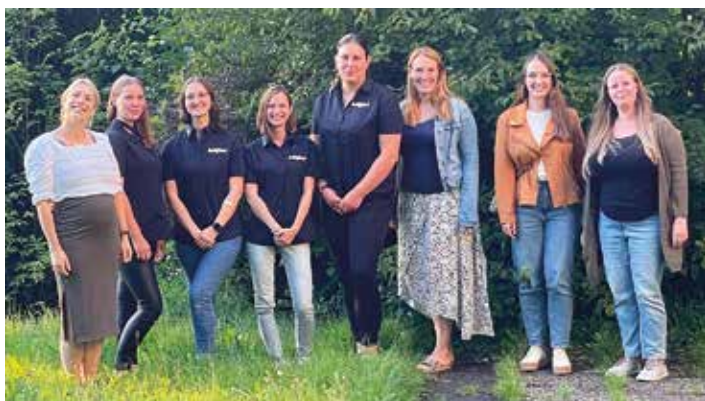
Zum Bild: Die Mitglieder vom Team der Zwergenstube sowie des Förderverein-Vorstands sowie Aktiven.

Im Vordergrund steht dabei der Spaß am Umgang mit Sprache. Was immer zum Ausdruck drängt, kann zu Papier gebracht werden. Papier ist geduldig – und bietet auf diese Weise Proberaum und Bühne für die eigenen Gedanken und Ideen. So entstehen Leichtigkeit und Freude beim Schreiben – und ganz nebenbei eine kleine Sammlung von fantasievollen Texten und wunderbaren Geschichten.