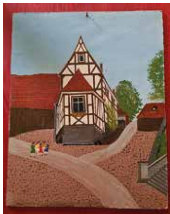
So sah Wendelin Wagner das Kleinstes Haus.

Die Vernissage ist am Freitag, 1. September, um 18 Uhr, im Kleinsten Haus; Finissage am 10. September, 17 Uhr. Die Ausstellung läuft an den Wochenenden vom 2. bis 3. September und vom 8. bis 10.