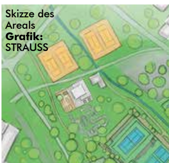
Skizze des Areal