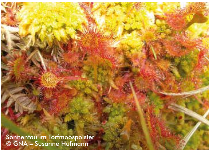
Sonnentau im Torfmoospolster