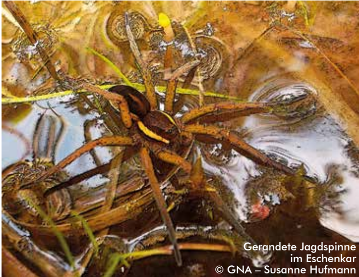
Gerandete Jagdspinne im Eschenkar