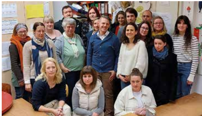
Zum Bild: Eltern machen mobil: „Platznot – wir packen es gemeinsam an!“

Gelnhausen / Main-Kinzig (red). Am Sonntag, 23. April, findet der zehnte „i-Lauf – Lauf für Inklusion“, der Lebenshilfe Gelnhausen statt. Der Verein freut sich auf zahlreiche Teilnehmer und Besucher. Um 9.30 Uhr fällt der Startschuss an der Sportanlage in Gelnhausen. Die Anmeldung ist online über www.lebenshilfe-gelnhausen.de bis zum 22. April möglich. Kurzentschlossene können sich noch morgens vor dem Start vor Ort anmelden. Für das leibliche Wohl ist gesorgt.