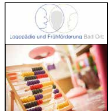
Logopädie und Frühförderung Bad Orb