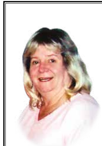
Bad Orb, im Juli 2022

WÄCHTERSBACH So., 21. 8., Gottesdienst, 10 Uhr So., 28. 8., Abendgottesdienst, 18 Uhr