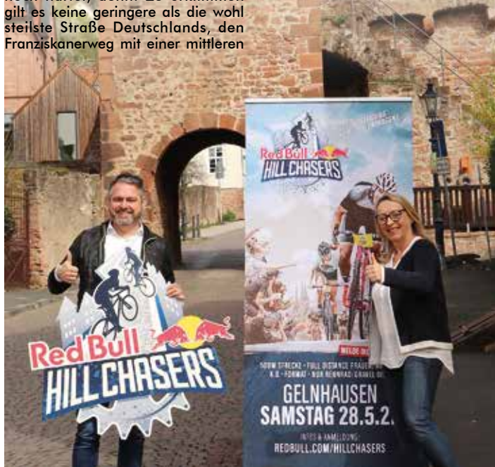
Zum Bild: Oberschenkel am Limit: Red Bull Hill Chasers kehrt am 28. Mai zurück nach Hessen, in die Barbarossastadt Gelnhausen.

Red Bull Hill Chasers ist ein Jedermann-Radrennen an der – mit bis zu 32-Prozent-Steigung – wohl steilsten Straße Deutschlands in Gelnhausen, Hessen. Gefragt sind Profis und Amateure gleichermaßen: Sie kämpfen Kopf an Kopf in 5er-Heats, auf zwischen Kopfsteinpflaster und geteertem Straße variierendem Untergrund, um den Einzug ins Finale. Jeder/e der/die genug Power in den Beinen hat und sich der Herausforderung gewachsen fühlt, kann mitmachen. Weitere Infos: redbull.com/hillchasers