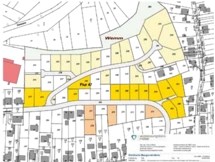
Hier entsteht nach Jahrzehnten der Planung ein neuer Stadtteil: Das Neubauggebiet Lauzenstraße.