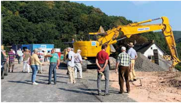
Das Interesse der Orber Bürger am Geschehen am neuen Sonnenhang der Kurstadt war groß. Familien mit Bauambitionen konnten sich auf eines der Grundstücke (links) bewerben.