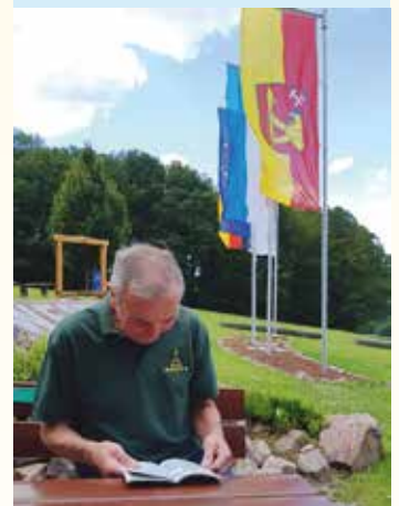
Von Autorin Christina Klose , Bad Orb

fenburg ab. Die neue Mitte der EU befindet sich nun in Gadheim (bei Veitshöheim Kr. Würzburg). Die 80-Seelen-Gemeinde will (lt. Medienberichten) den durch IGN (heisst: Nationales geographisches Institut) errechneten Acker einer Bäuerin in eine Blumenwiese umwandeln. Die Insekten werden sich freuen.