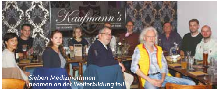
Sieben MedizinerInnen nehmen an der Weiterbildung teil.

Main-Kinzig (MKK/fw) . Um die hausärztliche Versorgung im Main-Kinzig-Kreis zu sichern und auf eine breitere und nachhaltige Basis zu stellen, setzt der Main-Kinzig-Kreis in Kooperation mit dem Allgemeinmedizinischen Weiterbildungsverbund Main-Kinzig auf die Stärkung der Weiterbildung im Bereich Allgemeinmedizin. Die Kooperationspartner wollen dabei gemeinsam daran mitwirken, dass genug Allgemeinmediziner im Main-Kinzig-Kreis ausgebildet und in der Region tätig werden. Letztlich soll die ambulante hausärztliche Versorgung der Bevölkerung langfristig flächendeckend sichergestellt und verbessert werden. Nun haben vier neue Weiterbildungsassistenten ihre Arbeit aufgenommen, die für die Dauer ihrer Weiterbildung in den Main-Kinzig-Kliniken angestellt sein werden.