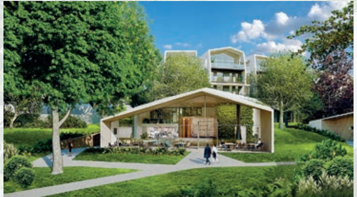
CLUBHOUSE. Lobby, Bar und Destination für große Ideen – und kulinarische Feuerwerke.