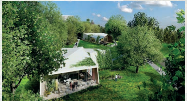
HOUSE OF MEDICAL EXPERTS. Pop-up-Praxis für Spezialisten und Koryphäen aus aller Welt.