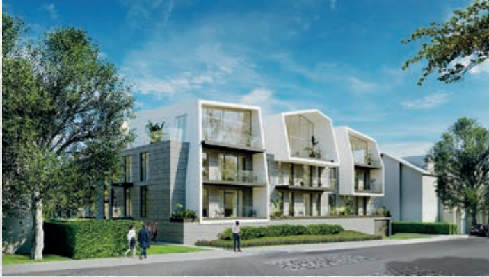
HIDEAWAY. Hochwertige Working Apartments für Mitarbeiter von Strauss.

Bad Orb / Biebergemünd (ES/gj). Engelbert Strauss baut am Rand des Bad Orber Kurparks einen neuen Firmenstandort: Mit dem „Alea Park“ schafft das Unternehmen ein hochwertiges Hospitality-Konzept. So empfängt Strauss künftig etwa Partner aus aller Welt zu Workshops und Strategie-Meetings in der Kurstadt. Auch die Mitarbeiter des Familienunternehmens profitieren vom Alea Park – Strauss erweitert sein umfangreiches Spa- und Fitnessangebot sowie die preisgekrönte Kulinarik.