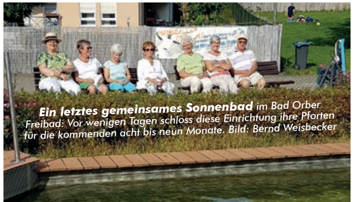
Ein letztes gemeinsames Sonnenbad im Bad Orber Freibad: Vor wenigen Tagen schloss diese Einrichtung ihre Pforten für die kommenden acht bis neun Monate.