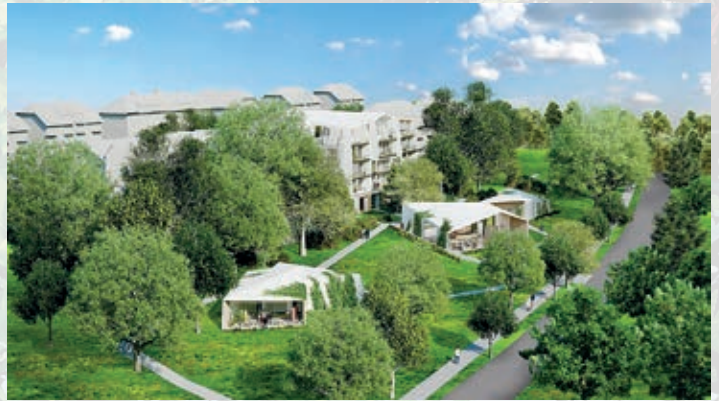
ALEA PARK. Auf einer Fläche von 8000m 2 entsteht das neue Strauss-Resort zum Leben und Arbeiten - Architektur: State of the Art.

„Die Investition bewegt sich im zweistelligen Millionenbereich“, verriet Henning Strauss auf Nachfrage, ohne jedoch zu konkret zu werden.