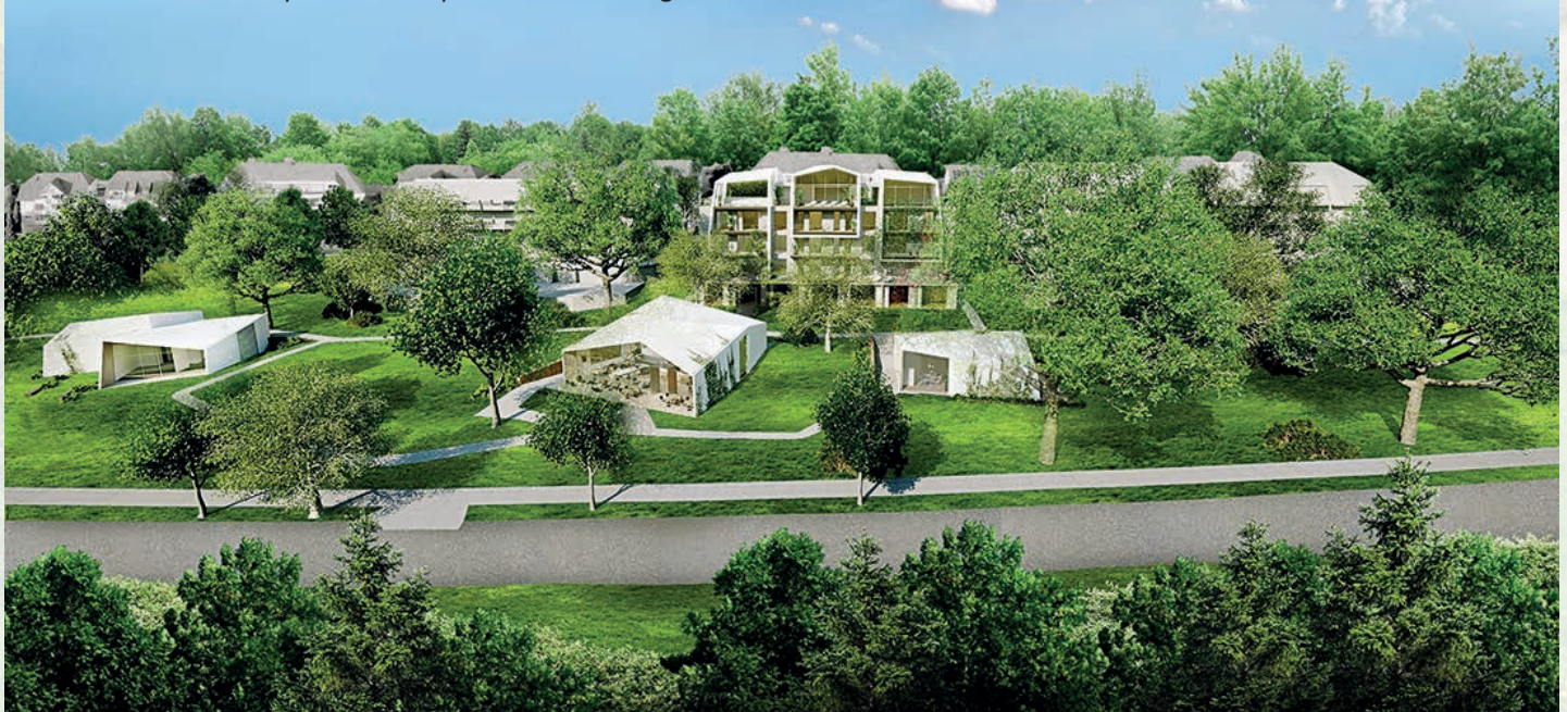
BEVEL HOUSE. Exklusive Apartment Unit für besondere Gäste – Accommodation inklusive privatem Sole Spa. Text / Bilder: Engelt Strauss