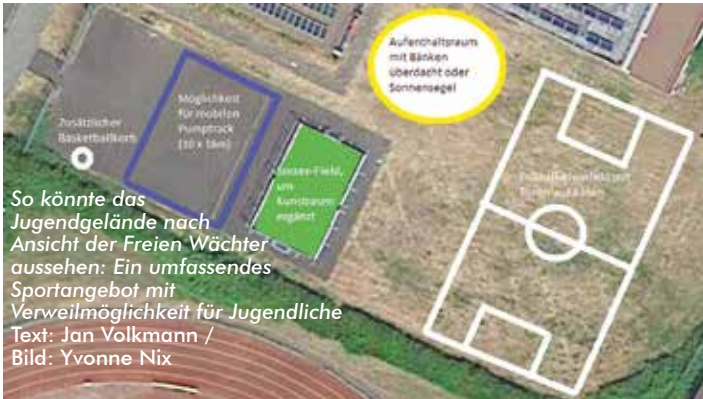
So könnte das Jugendgelände nach Ansicht der Freien Wächter aussehen: Ein umfassendes Sportangebot mit Verweilmöglichkeit für Jugendliche Text: Jan Volkmann

Wächtersbach (FW). Die lokalpolitische Bewegung „Freie Wächter“ macht Druck bei der beabsichtigten Einrichtung eines Jugendgeländes in Wächtersbach. Sie reichen zur nächsten Stadtverordnetenversammlung am 9. September einen Antrag ein. „Das Jugendgelände soll zwischen der Turnhalle und dem Sportplatz in Wächtersbach entstehen“, erklärt Anja Piston-Euler. Die Stadtverordnete sitzt für die Freien Wächter im Jugendausschuss der Stadt Wächtersbach. Sie ergänzt: „Bemerkenswert, dass sowohl das Wächtersbacher Rathaus als auch die Arbeitsgruppe Familie der Freien Wächter dieses Gelände unabhängig voneinander als geeignet befunden haben.“ Die Vorteile lägen auf der Hand: „Der Platz liegt sehr zentral und zusätzlich in der Nähe der Schule, sodass die Jugendlichen es alle kennen und Dank der Busverbindung auch aus den Stadtteilen gut erreichen können. Es gibt kaum Anwohner und diese werden zusätzlich durch die Turnhalle von etwaigem Lärm abgeschirmt“, so Piston-Euler. Außerdem habe sich