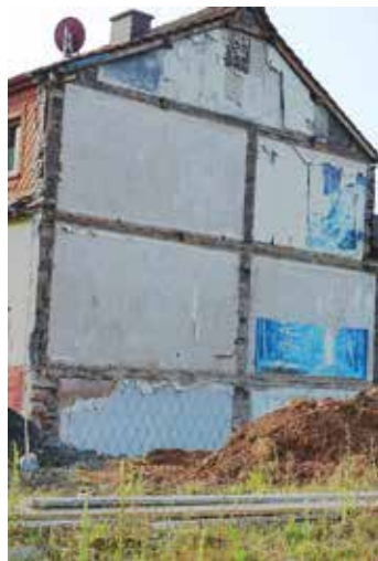
Bild Einfahrtstraße nach Bad Orb Frankfurter Straße Tut er wirklich alles?“

„Unser Bürgermeister Weiss tut alles für Bad Orb!“