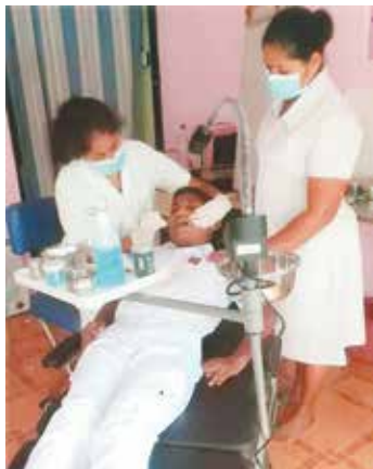
Neue Zahnarztstühle erleichtern die Arbeit in den Zahnkliniken in Aluthgama und Dharga Town.