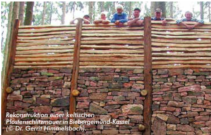
Rekonstruktion einer keltischen Pfostenschlitzmauer in Biebergemünd-Kassel.