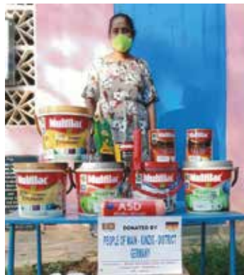
Das feucht-warme, tropische Klima greift die Bausubstanz an, deshalb wird der Kindergarten von Anandagama mit wasserfester Farbe neu gestrichen.