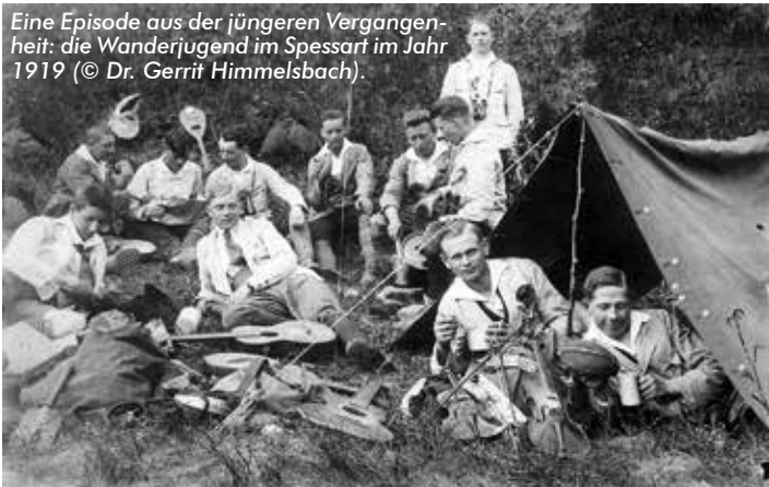
Eine Episode aus der jüngeren Vergangenheit: die Wanderjugend im Spessart im Jahr 1919.

Main-Kinzig / Biebergemünd (BP/cj). Mit der Geschichte des Spessarts befasst sich die neue Online-Vortragsreihe, zu der die Bildungspartner Main-Kinzig GmbH in Kooperation mit dem Archäologischen Spessartprojekt (ASP), der Bayerischen Wanderakademie und dem Spessartbund einlädt. Seit 19. April und bis zum 6. Dezember finden insgesamt zwölf spannende Vorträge mit dem Archäologen und Historiker Dr. Gerrit Himmelsbach vom ASP statt.