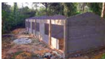
Das neue Schulgebäude der Badanagoda Junior School im Rohbau. Hier werden bald drei Unterrichtsräume für den Schulbetrieb zur Verfügung stehen.

Den staatlichen Zahnstationen in den Nachbarstädten Aluthgama und Dharga Town wurden Anfang des Jahres moderne Zahnarztstühle übergeben. Sie sind nicht nur für die Vorsorgeuntersuchungen der Kinder